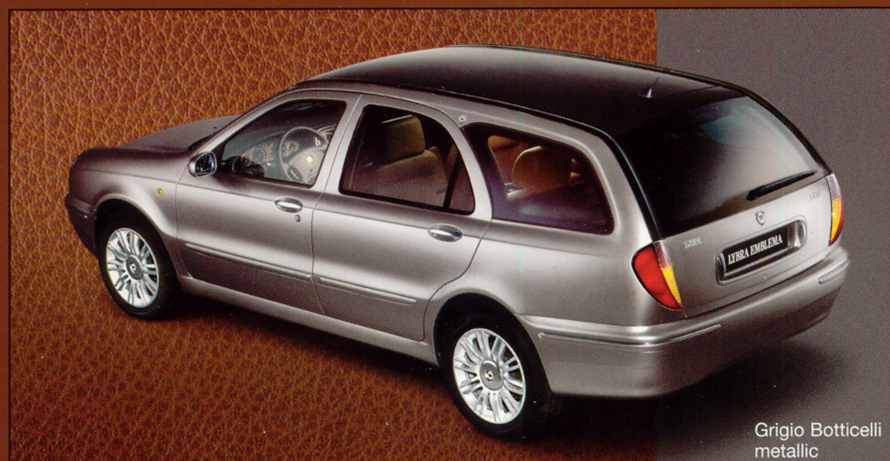
Grigio Botticelli metallic