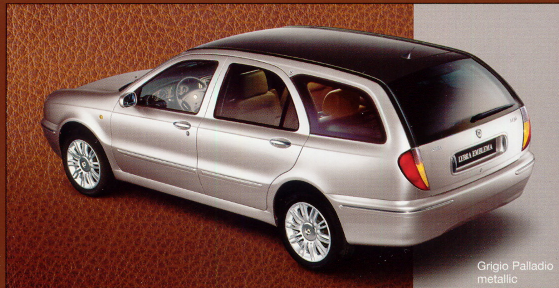
Grigio Palladio metallic