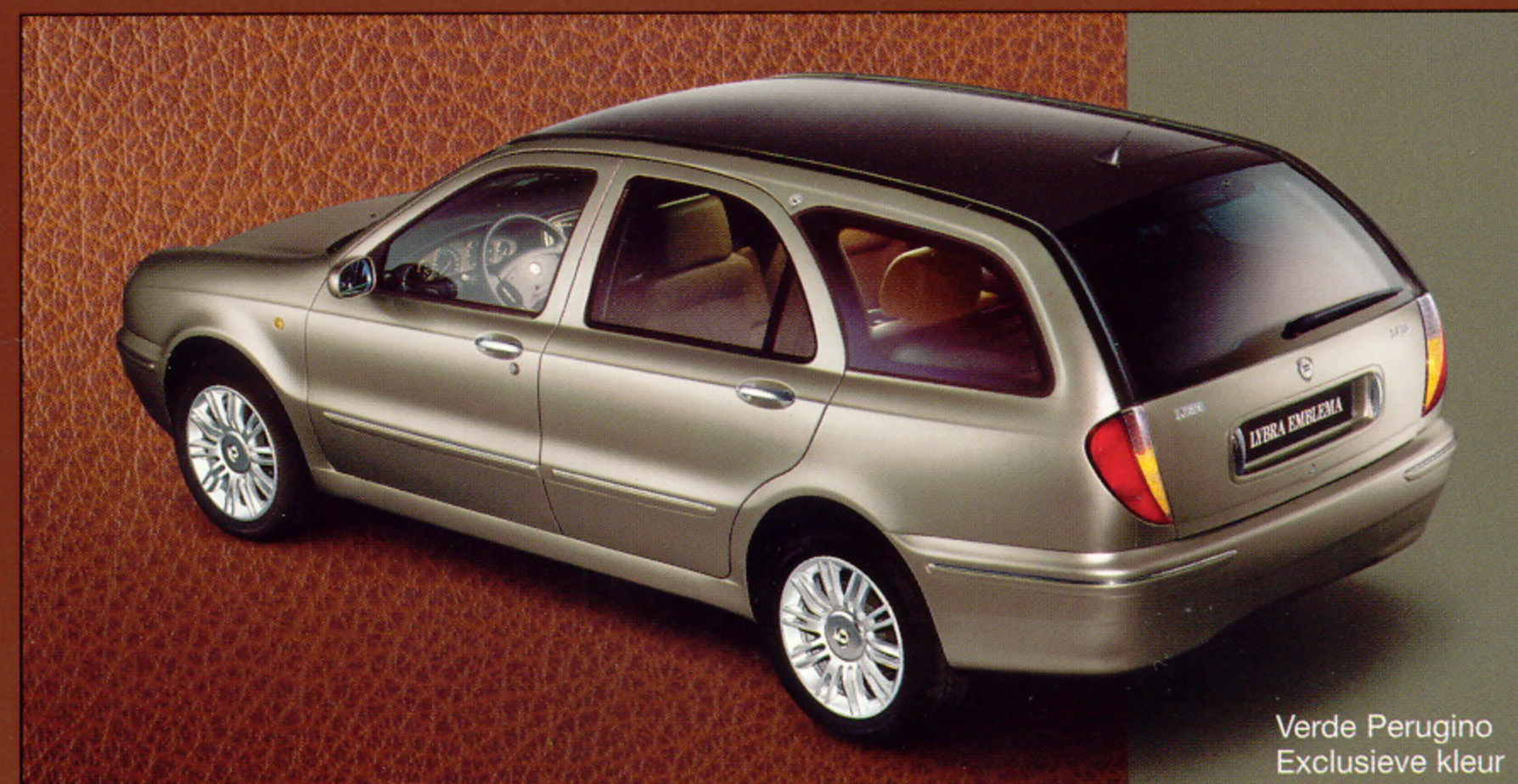
Verde Perugino Exclusieve kleur