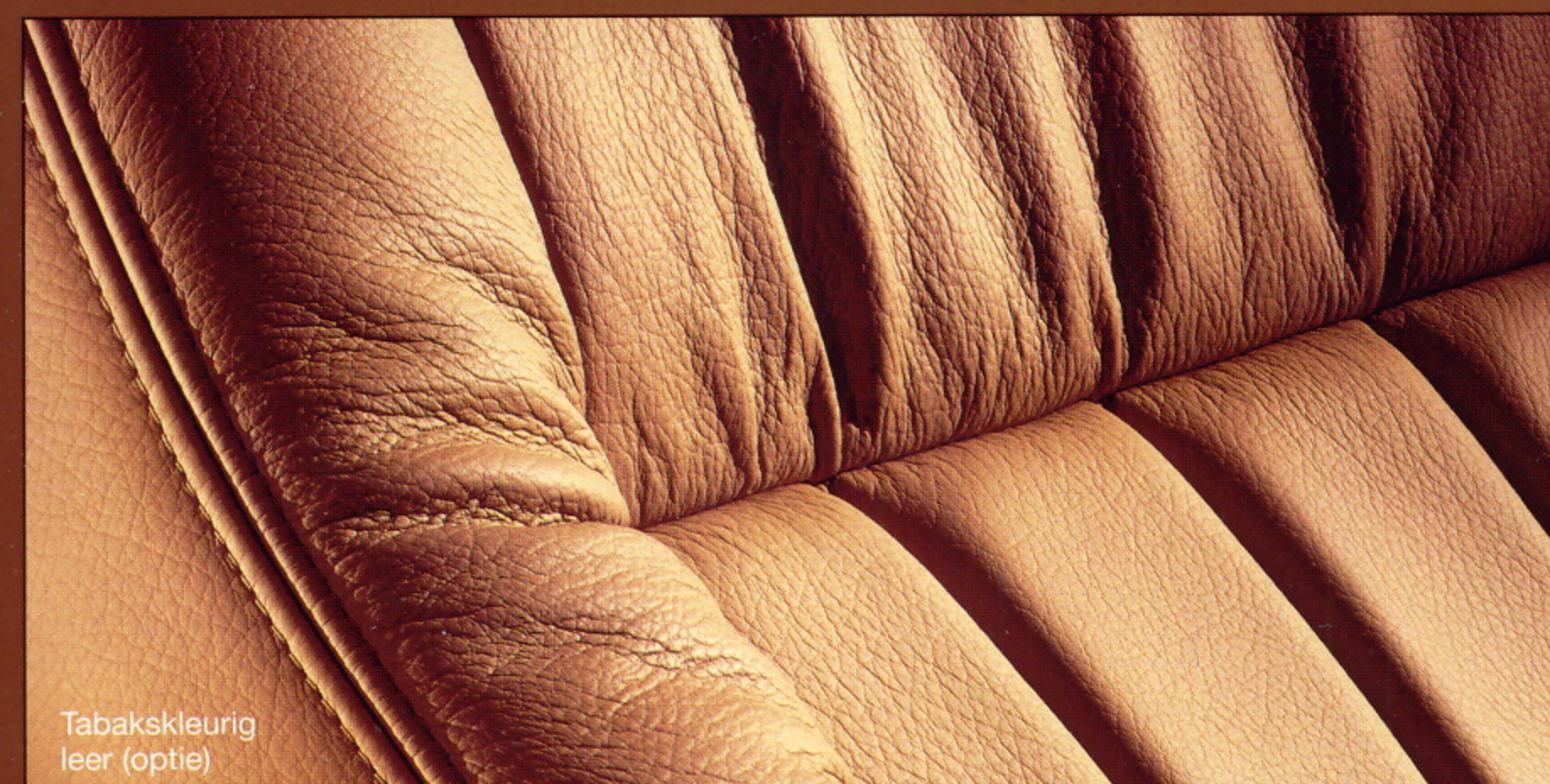
Tabakskleurig leer (optie)