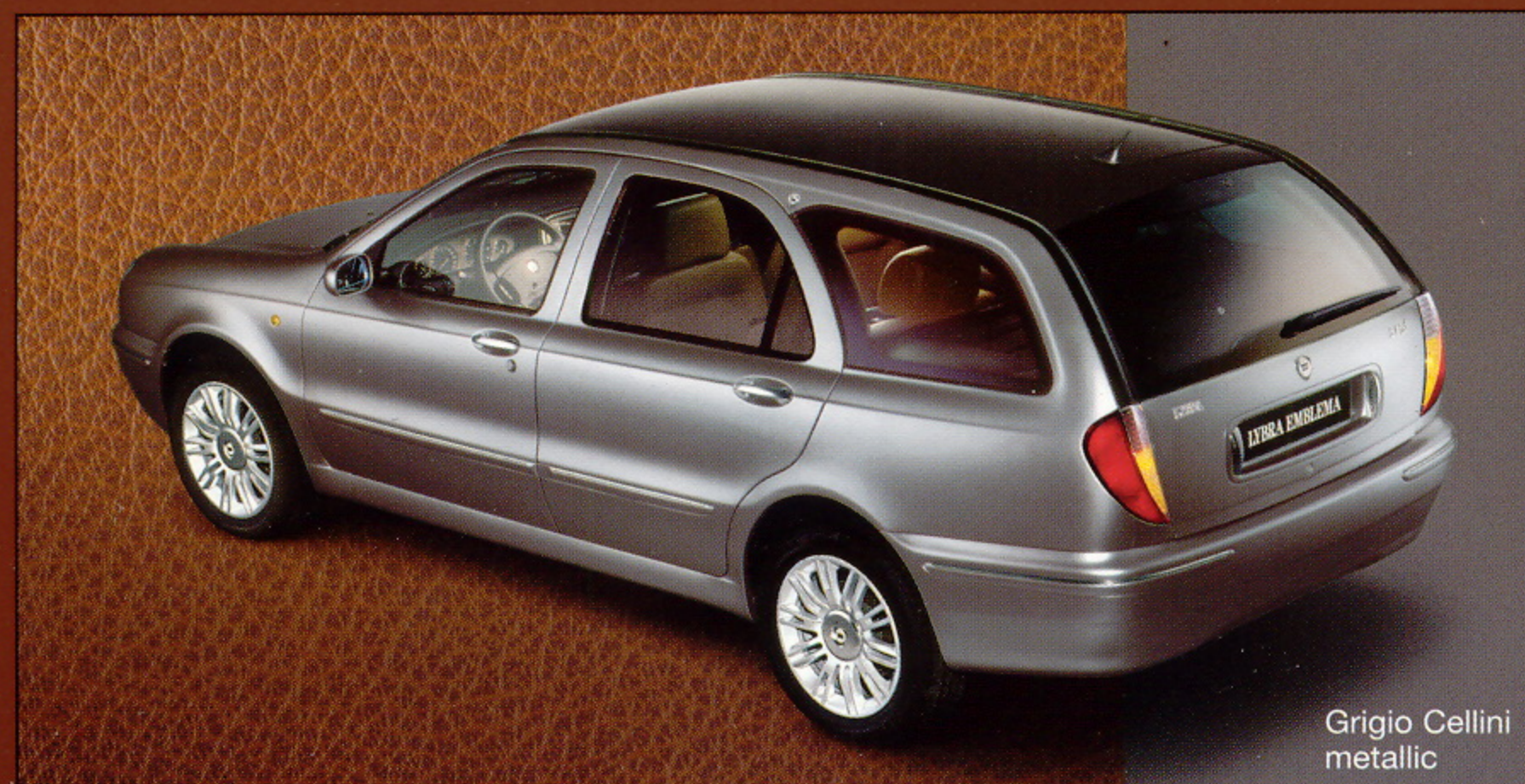
Grigio Cellini metallic